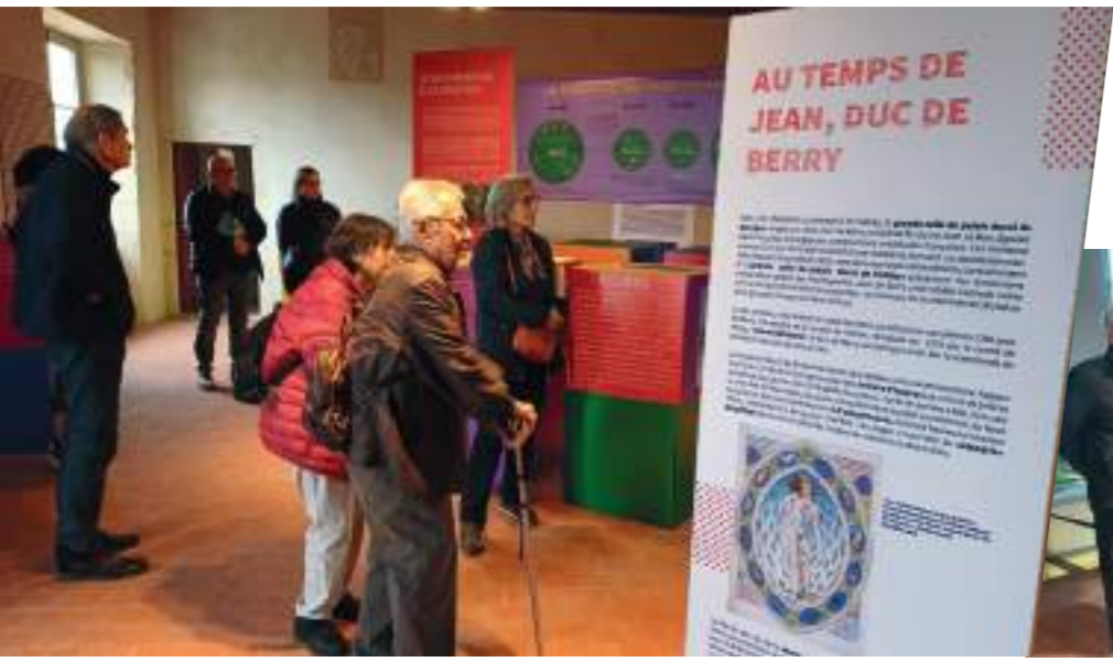
L'âge du bois au château des Tours Exposition Pays d'Arts et d'Histoire.