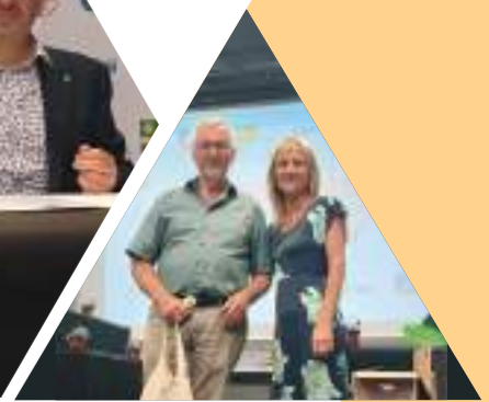
Les 45 ans du jumelage Anse – Lossburg La commune de Anse a accueilli 120 habitants de Lossburg et 10 Hongrois de Harta pour la célébration de ces 45 ans. De beaux temps d'échanges qui permettent de toujours mieux se connaître.