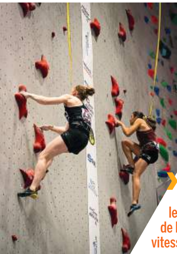
➤ AL Escalade : prêts pour le championnat de France de vitesse Seniors !

Les tournois du Tennis club Ansois : le trophée Colas pour les jeunes et le tournoi femmes et seniors 45 +