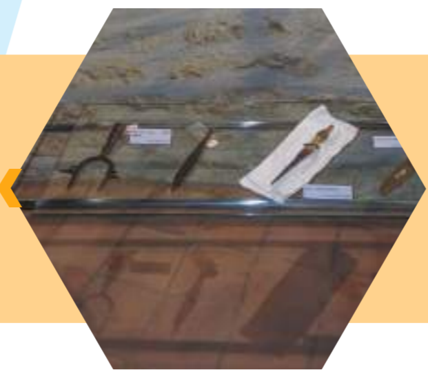
Exposition de la collection Rebut-Blanc