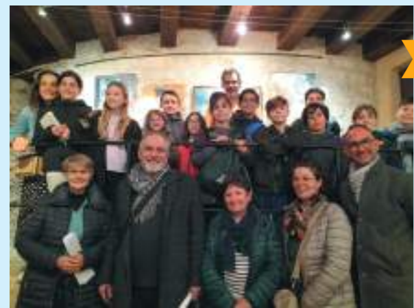
Le Salon des artistes locaux organisé par 2CEA